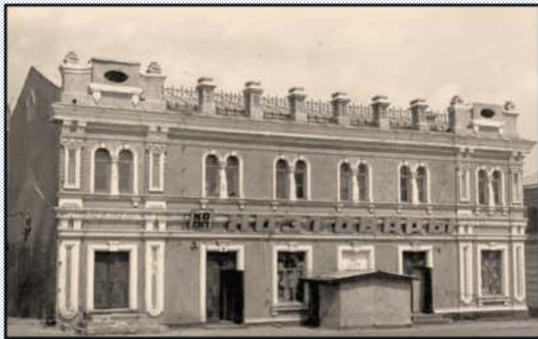
Бобринське повітове училище