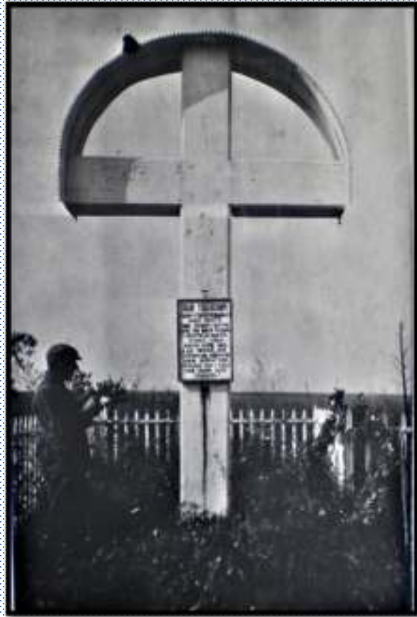
Могила І.К.Тобілевича на кладовищі села Карлюгівка, поблизу хутора «Надія»

У 1906 році Іван Карпенко-Карий захворів, залишив сцену й виїхав на лікування до Німеччини. 15 вересня 1907 року він помер у Берліні. Тіло перевезено в Україну й поховано на кладовищі в селі Карлюжині біля хутора Надія.