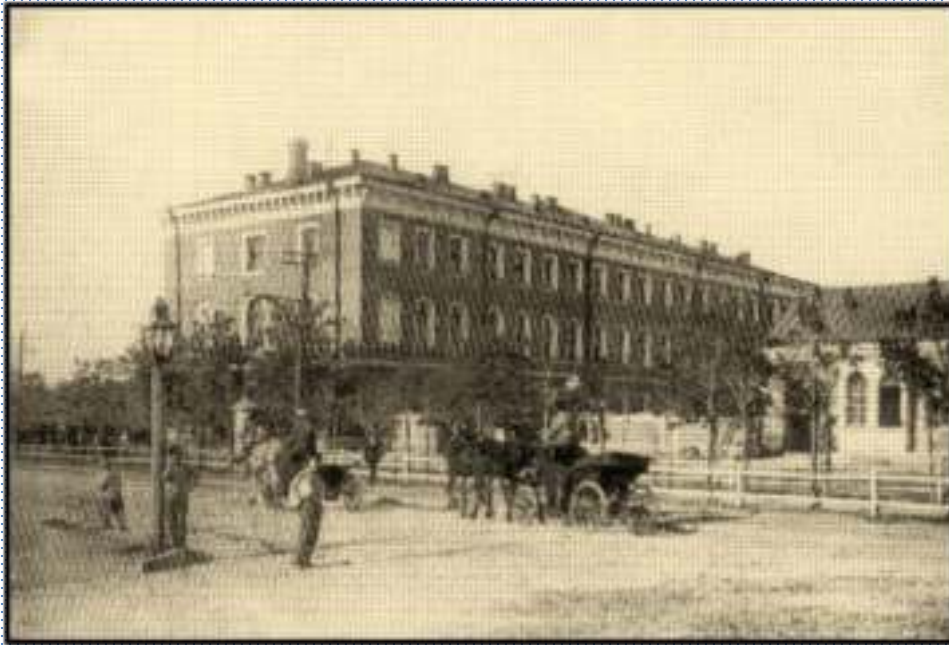
Театральна площа міста Єлисаветграда

З 1965 року в місті Єлисаветграді Херсонської губернії Тобілевич працює в повітовому, потім у міському поліцейському управлінні.