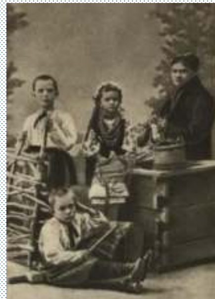
Діти Карпенка-Карого з нянею

Надія Карлівна народила йому 7 дітей. 1881 — І.Карпенко-Карий втратив дружину, наступного року померла дочка Галина.